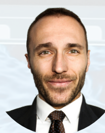
Semian Mejak Odvjetnički ured Semian Mejak